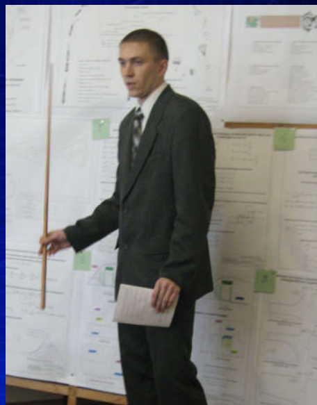
Защита диплома – июнь 2008