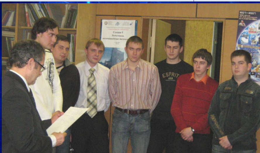
Итоговый зачет по ННПП – март 2008