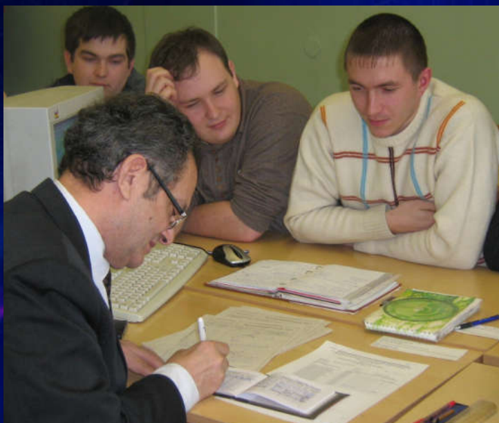
Последний экзамен – осень 2008