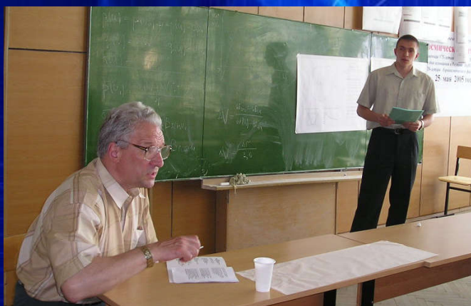
Доклад на конференции ВНТК-2005